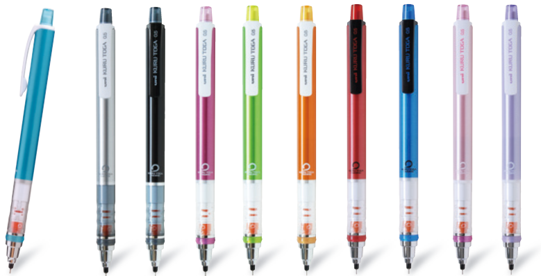
ブルー シルバー ブラック ピンク グリーン オレンジ レッド ネイビー ベビーピンク バイオレット