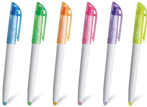
ブルー グリーン オレンジ ピンク バイオレット イエロー